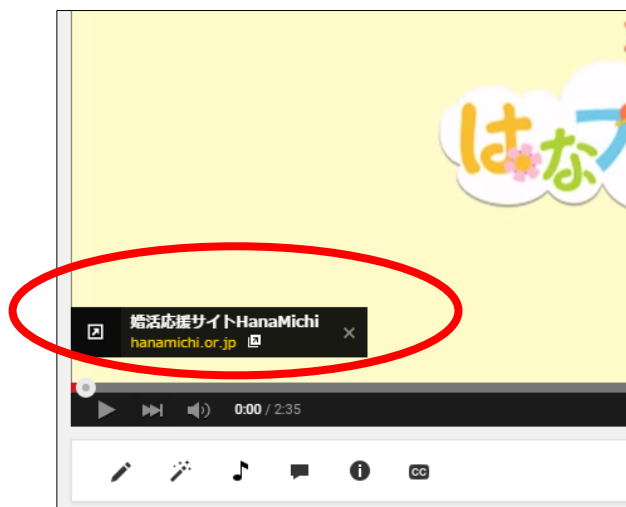
YouTube画面。NPO向け無料広告サービスを使い、動画からHPIに直接アクセスできるようにしました。