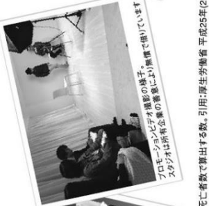
プロモーションビデオ撮影の様子。スタジオは所有企業の事業場により提供されています