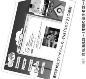
専門学校生がデザインした、SNS「はなみち」の画面