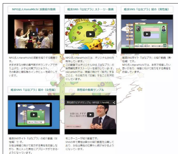
動画集サイト画面

また、YouTubeやGoogle for NonprofitsといったNPO向け無料サービスを活用し、「結婚したいけれどできていない」方がHanaMichiに辿り着くための多様なチャネルを設けました。