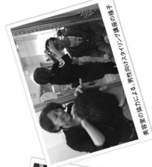
美空聖の協力による、男性向けスタックリング講座の様子