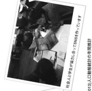
社会人と学生が協力し合っ、SNSを作っています