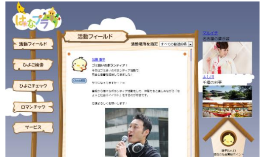
「はなプラ」トップページの画像